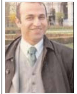
همسر اتریشی کامران قادری که ده ماه پیش در تهران بازداشت شده بود بالاخره تصمیم گرفت مورد همسر زندانش سخن بگوید.

است یا نه؟ گفتنی است پیشتر این وزیر زن افغان تبار تابعیت ایرانی خود را تکذیب کرده و گفته است او تابعیت افغان - کانادایی دارد، با این حال او یک ماه پیش اعلام کرده است که به تازگی از مادرش شنیده که در ایران (مشهد) متولد شده است. مریم منصف ۳۱ سال دارد و خانواده او در سال ۱۹۹۶ و زمانی که او تنها ۱۱ سال داشت به کانادا مهاجرت کرده اند. او پیشتر بارها در واکنش به گزارش های رسانه های کانادایی درباره احتمال تبعیت ایرانی خود، این موضوع را رد کرده و گفته است با توجه به قوانین ایران به رغم تولد