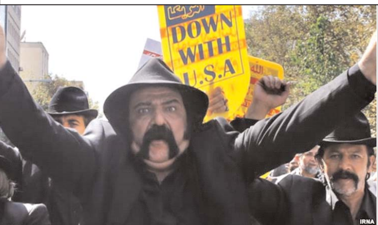
تبریز در سال ۷۸ و ۸۸ از همین نیروها استفاده شد.

سرکوب اهالی رسانه ها حکومت برای کنترل رسانه ها از ابزارهای کافی مثل خودداری از صدور مجوز، سانسور، توقیف، و بازداشت توسط نیروهای نظامی و انتظامی و سپاهی برخوردار بوده است و اکثر موارد سرکوب توسط گریان حضور دارند. سرکوب دانشجویان حکومت برای سرکوب دانشجویان معترض و منتقد مجموعه ای از اراذل و اوباش را به عنوان دانشجویان بسیجی وارد دانشگاه کرده است. این ها نسل جدید اوباش در دوره جمهوری اسلامی هستند. اما در شرایطی که بسیجیان نخواهند یا نتوانند حرکتی را سرکوب کنند از اراذل و اوباش سازمان یافته غیر دانشجوی هم استفاده شده است. در مجراهای کوی دانشگاه تهران و