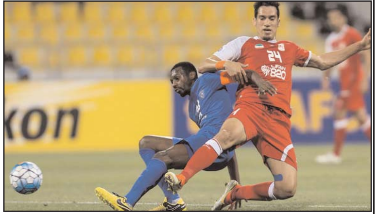
اترین درحسرت یک گل سوخت تیم فوتبال تراکتورسازی تبریز که دیدار رفت برابر النصر امارات را با شکستی سنگین پشت سر گذاشته