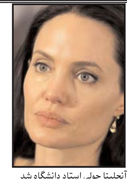
آنجلینا جولی استاد دانشگاه شد

یکی از دانشگاه های برتر بریتانیا، دانشگاه اقتصاد لندن، آنجلینا جولی را به عنوان استاد مهمان این دانشگاه انتخاب کرد. این هنرپیشه هالیوود به مرکز زنان، صلح و امنیت دانشگاه می پیوندد و در برنامه تحصیلی جدید دانشگاه زنان، صلح و امنیت تدریس خواهد کرد. مدارک دانشجویان متقاضی برای تحصیل در این رشته از پاییز ۲۰۱۶ پذیرفته می شود. کلاس های درس قرار است از پاییز ۲۰۱۷ آغاز شود.