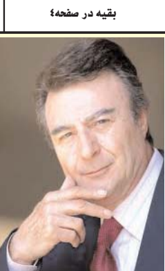
بقیه در صفحه ۴

فروشنده' که در ابتدا پرسد به دست آهو نام داشت از مرحله تولید نشاهد چند نوآوری تازه از سوی