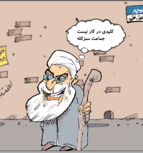
آغاز میگردد ...

در رقابت های پیش انتخاباتی ریاست جمهور آمریکا، دونالد ترامپ از حزب جمهوری خواه و هیلاری کلinton از حزب دمکرات با پیروزی های جدید فاصله خود را از رقبایشان بیشتر کردند. این بار رقابت های پیش انتخاباتی در پنج ایالت دلوور، پنسیلوانیا، مریلند، رود آیلند و کنتیکت برگزار شد و دونالد ترامپ موفق شد در هر پنج ایالت بر رقبای خود پیروز شود. وزیر امور خارجه پیشین آمریکا در چهار ایالت