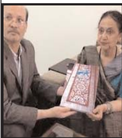
فارسى در تعدادى از دانشگاهها مانند علیگر، جواهر لعل نهرو و دانشگاه دهلی و تعدادی از مراکز آموزش فارسی تدریس می‌شود.