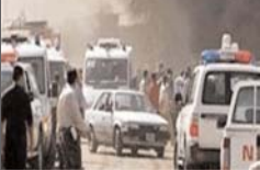
گروه حکومت اسلامی به یک پایگاه ارتش عراق در نزدیکی بغداد روی داد. در آن حملات که ارتش عراق آن را دفع کرد، دست کم ۱۲ نفر از نترات ارتش عراق کشته شدند.

ارتش عراق آن را دفع کرد، دست کم ۱۲ نفر از نترات ارتش عراق کشته شدند.