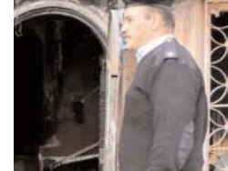
در حمله به یک کلوب شبانه در قاهره، پایتخت مصر، ۱۶ نفر کشته شدند. حمله در ساعات ابتدایی جمعه ۱۳ آذر انجام شده است. خبرگزاری رسمی مصر به نقل از یک مقام امنیتی گزارش داده که سه مرد

سوار بر موتورسیکلت، چند کولک مولوتف را به درون این کلوب شبانه پرتاب کردند و بلافاصله از محل گریختند. وزارت کشور مصر در اطلاعیه ای اعلام کرده که شواهد اولیه نشان می دهد مهاجمان، کارکنان کلوب بودند که با همکاریانشان دچار اختلاف شده بودند. مناطق مختلف مصر در سال های گذشته بارها هدف حملات تروریستی به ویژه از سوی گروه های وابسته به حکومت اسلامی قرار داشته است.