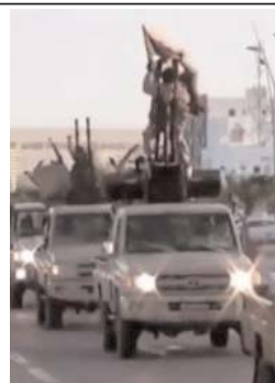
خلافات خودخوانده گروه افراطی موسوم به دولت اسلامی یا داعش، با مشکل کمبود پول و درآمد روبرو شده است.

عراق و سوریه و بازپس گرفته شدن بخش هایی از مناطق تحت تصرف آن گروه، بخش های بزرگی از منابع درآمد داعش در حال نابودی است. طبق آخرین برآوردها گروه داعش ثروتمندترین گروه تروریستی در جهان است و تا چندین پیش تنها از فروش نفت ماهانه ۴۰ میلیون دلار درآمد داشته است. از جمله درآمدهای دیگر داعش، مالیات گرفتن از مردم ساکن در مناطق تحت سلطه خود و مصادره اموال آنها، باجگیری، قاچاق عتیقه و آثار باستانی عراق و سوریه، و فروش زنان و دختران به عنوان برده و کنیز بوده است. در دور جدید مبارزه بین المللی علیه داعش، قطع منابع کسب درآمد آن گروه مورد توجه قرار گرفته است.