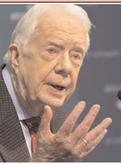
می دهد که تومور وجود ندارد. گفته می شود جیمی کارتر که در امور خیرخواهانه فعال بوده است، زمان زیادی را زیر نور آفتاب طی کرده بود. تابش شدید و طولانی نور آفتاب می تواند در افرادی که بدون کرم ضد آفتاب در معرض آن قرار می گیرند، سرطان پوست ایجاد کند.

جیمی کارتر روز یکشنبه گفت تومور سرطانی مغز او به دنبال درمان های اخیر ناپدید شده است. آقای کارتر، ساله که در دوران انقلاب ایران رئیس جمهوری آمریکا بود، ماه اوت امسال گفت نوعی سرطان پوست دارد که به کبد و مغز او نیز سرایت کرده است. آقای کارتر که برنده جایزه صلح کلیسای باپتیست شهر زادگاهش در پلیموث، واقع در ایالت جورجیا این مطلب را گفت. او مدت ها به طور مرتب روزهای یکشنبه در این کلیسا سخنرانی می کرد. حدود نفر در کلیسا شاهد سخنرانی آقای کارتر بودند که با گفتن جملات در درباره ناپدید شدن تومور سرطانی، ابراز شادمانی کردند. بر اساس گزارش ها، او گفت نتیجه اسکن مغزی که دریافت کرده نشان