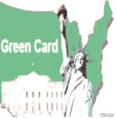
قرعه کشی گرین کارت آمریکا از تاریخ نهم مهرماه، اول اکتبر شروع و در تاریخ ۱۲ آبان، سوم نوامبر به پایان رسید.

فیس بوک وزارت خارجه آمریکا به زبان فارسی و سایت سفارت مجازی آمریکا، در مطلبی به شهروندان ایرانی هشدار دادند که مراقب تقلب مربوط به قرعه کشی گرین کارت باشند. در فیس بوک وزارت خارجه آمریکا آمده مطلع شده ایم که در روزهای اخیر تعداد ایمیل های تقلبی و جعلی در مورد موفقیت در قرعه کشی گرین کارت افزایش چشمگیری داشته اند. بار دیگر یادآوری می کنیم که وزارت امور خارجه و دولت آمریکا متقاضیان موفق در قرعه کشی گرین کارت را از طریق ایمیل، نامه کتبی یا تلفن مطلع نمی کند. شرکت کنندگان در قرعه کشی می توانند پس از اعلام نتایج، وضعیت پرونده خود را با مراجعه به تارنمای قرعه کشی بررسی کنند و از موفقیت یا عدم موفقیت خود کسب اطلاع کنند. ایمیل های ایجنسی صرفاً جعلی و بی اساس بوده و با هدف سرقت اطلاعات شخصی و سوء استفاده مالی از دریافت کننده ایمیل ارسال می شوند.