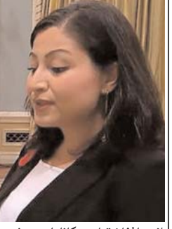
بانوی افغان تبار در کانادا وزیر شد. مریم منصف، سیاستمدار افغان تبار کانادایی که ماه پیش به مجلس این کشور راه یافت، امروز به عنوان وزیر نهادهای دموکراتیک دولت جدید کانادا معرفی شد. خانم منصف امروز در کنار جاستین ترودو، نخست وزیر و دیگر اعضای کابینه جدید کانادا سوگند یاد کرد. آقای ترودو امروز کابینه ۳۱ عضوی خود را معرفی کرد که ۱۴ تن از آنها

زن هستند. خانم منصف در زمان رژیم طالبان در سال ۱۹۹۶ و در سن ۱۱ سالگی همراه با دو خواهر و مادر بیوه اش از افغانستان فرار کرد و به کانادا رفت. او متولد شهر هرات در غرب افغانستان است و به گفته خودش پیش از مهاجرت با خانواده اش در ایران پناهنده بودند. او جوان ترین عضو کابینه جدید کانادا و نخستین زنی است که به نمایندگی از منطقه پیتربرو در ایالت انتاریو به مجلس این کشور راه می یابد. خانم منصف عضو حزب لیبرال کانادا است و سال ها در این کشور مشغول فعالیت سیاسی و اجتماعی بوده است. یکی از مسئولیت های مهم خانم منصف در مقام جدیدش به عنوان وزیر نهادهای دموکراتیک، بازنگری در نظام انتخاباتی کانادا و تبدیل آن به نمایندگی تناسبی است.