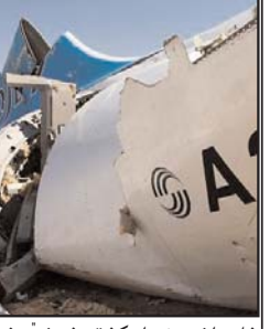
شاهدان عینی از کشته شدن بیش از ۴۰ تن در سانحه سقوط یک فروند هواپیمای باربری روسی در سودان جنوبی خبر می دهند. هنوز روشن نیست این هواپیما چه تعداد سرنشین داشته است. منابع خبری از سقوط یک فروند هواپیمای ترابری روسی در سودان جنوبی خبر داده اند. این هواپیما که تعدادی مسافر را نیز حمل می کرد، چهارشنبه (۴ نوامبر / ۱۳ آبان) اندکی پس از بلند شدن از فرودگاه جوبا، پایتخت سودان جنوبی، سقوط

کرد. رویترز به نقل از یک مقام رسمی و یک شاهد عینی می نویسد، دست کم ۴۱ نفر در این سانحه کشته شده اند. تعدادی از کشته شدگان سرنشینان هواپیما و بقیه کسانی بودند که در محل سقوط حضور داشتند. سخنگوی ریاست جمهوری سودان گفت، دو نفر، از جمله یک کودک نجات یافته اند. به گفته او، احتمال می رود که این هواپیما حدود ۲۰ سرنشین داشته که شامل خدمه و ۱۰ تا ۱۵ مسافر می شده است. شمار افرادی که بر روی زمین کشته شدند، نیز هنوز معلوم نیست. رویترز به نقل از یک مقام دولتی سودان جنوبی گزارش داده که هواپیما در نزدیکی فرودگاه بین المللی جوبا سقوط کرده است. یکی از گزارشگران خبرگزاری آسوشیتد پرس در نزدیکی محل حادثه گفته است، لاشه هواپیما در ساحل شرقی رود نیل افتاده است.