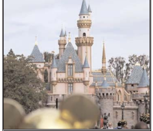
خیز شرکت‌های مسافرتی برای سفر به آمریکا

ده نکته درباره نامه خامنه‌ای آیت‌الله خامنه‌ای نمی‌خواست و نمی‌خواهد که جامعه حول مسئله هسته‌ای دو قطبی شود. اما شاهد آن بود که پس از طی مراحل قانونی نیز