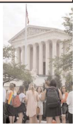
دوره جدید دیوان عالی کشور آمریکا بعد از سه ماه فترت روز

دوشنبه آغاز می‌شود. مهمترین قوانینی که در دوره قبل دیوان عالی کشور در آمریکا به تأیید رسید، ازدواج همجنسگرایان، و قانون بیمه سلامتی موسوم به اوباما‌کر در ماه ژوئن گذشته بود. چند پرونده مهم قرار است در دوره جدید مورد بررسی قرار می‌گیرند، از جمله تقسیم بندی‌های جدید جغرافیایی که ممکن است بر شمارش آرا در انتخابات تأثیر بگذارد. یکی دیگر از موضوعات همچنین پرداخت ماهانه اعضای اتحادیه‌های صنفی در بخش عمومی است. به گفته رسانه‌های آمریکایی، در این دور احتمال دارد جمهوری خواهان شاهد صدور آرای باشد که مورد حمایت آنان باشد.