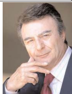
پرویز قاضی سعید

دامن میزند؟! مشغول بررسی این مسئله هستد که مقاله «جیل تروی» پرفسور تاریخ و علوم سیاسی در نشریه دلی پست انتشار می یابد که رسماً و علناً نوشته است او با مزارع فریب مسلمانانی را خورد که خود را بعنوان میانه رو جا زدند و او با مزارع فریب دادند و او باور کرد که در میان آخوندهای متعادل و میانه رو هم وجود دارد.