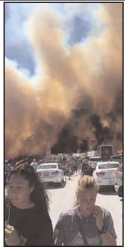
آتش سوزی در دامنه تپه های

جنوب کالیفرنیا بسرعت به يك گذرگاه کوهستانی سرایت کرد، که در نتیجه یک بزرگراه مسدود شد، بیش از ۲۰ اتومبیل سوختند، و به ۱۰ اتومبیل دیگر خسارت وارد شد. ۴ بنا نیز طعمه حریق شد. سازمان جنگلبانی آمریکا می گوید آتش، که ابتدا نزدیک به ۲۰۰ هکتار بوته زارهای تپه های جنوب کالیفرنیا را پوشانده بود، به سرعت، ظرف چند ساعت، به منطقه ای به وسعت بیش از ۱۴۰۰ هکتار سرایت کرد. این حادثه تلفات جانی نداشته است؛ اما بیشتر ساکنان دامنه کوهها ممکن است مجبور به تخلیه منازل خود شوند، تا مأموران آتش نشانی بتوانند آتش را خاموش کنند.