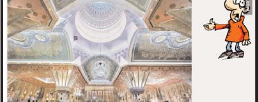
قبرستان حسینی که بدست جمهوری اسلامی ساخته شد