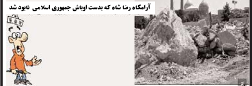
آرامگاه رضا شاه که بدست اوپاش جمهوری اسلامی نابود شد

عبدالفتاح السیسی که در پی سرنگونی حکومت مرسی از دو سال پیش رئیس‌جمهوری مصر شده است، اخوان المسلمین را تهدیدی برای امنیت مصر می‌داند. اخوان المسلمین اما فعالیت خود را صلح آمیز دانسته است.