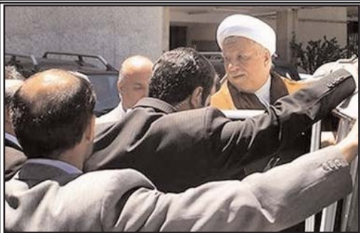
تشنج و جنجال در دانشگاه امیر کبیر به علت سخنرانی رفسنجانی