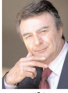
پرویز قاضی سعید