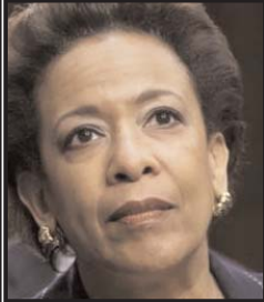
وی توسط آقای اوباما، صلاحیت لورتا لینچ را تایید کردند.

سنای آمریکا روز پنجشنبه (دیروز) صلاحیت لورتا لینچ، نامزد احراز پست دادستان کل کشور از سوی باراک اوباما رئیس جمهوری آمریکا را تایید کرد. خانم لینچ نخستین زن آمریکایی آفریقایی تباری است که پست دادستانی کل آمریکا را احراز می کند.