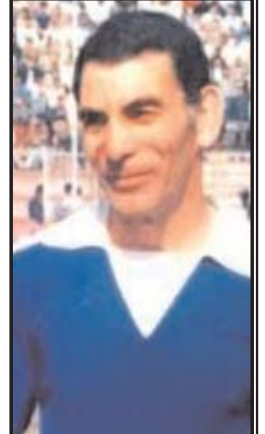
عزیز اصلی دروازه بانی که سابقه پوشیدن پیراهن تیم ملی فوتبال ایران را داشت به علت بیماری درگذشت.

به گزارش خبرنگار مهر، این دروازه بان که علاوه بر فوتبال در چند فیلم سینمایی نیز ایفای نقش کرده بود، پس از تحمل یک دوره بیماری امروز پنجشنبه در سن ۷۹ سالگی در بیمارستانی در شهر دوسلدروف آلمان جان به جان آفرین تسلیم کرد. عزیز اصلی که سالها از دروازه تیم فوتبال پرسپولیس محافظت کرده بود از چندی پیش به خاطر بیماری در بیمارستان بستری شد و امروز درگذشت. وی سابقه پوشیدن پیراهن تیم ملی فوتبال ایران را نیز در کارنامه داشت. گروه ورزشی روزنامه عصر امروز این ضایعه را به جامعه فوتبال و خانواده مرحوم عزیز اصلی تسلیت می‌گوید.