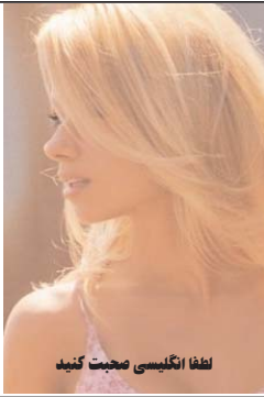
لطفا انگلیسی صحبت کنید

BEAUTY LOLA You stressed and relief? I just the cure all for you 213-369-3220