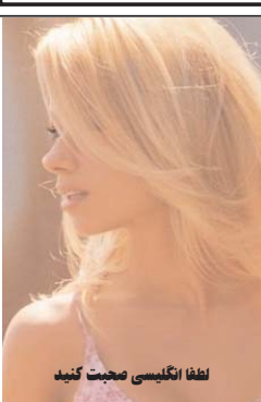
لطفا انگلیسی صحبت کنید

BEAUTY LOLA You stressed and relief? I just the cure all for you 213-369-3220