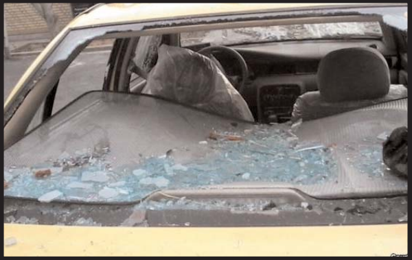
اخیراً خورگزاری خانه ملت گذاشته است که آنرا در زیر مطالعه می فرمائید.

علی مطهری نماینده تهران روز گذشته در سفر به شیراز برای ایراد سخنرانی مورد حمله گروهی از ارازل و اوباش حکومتی قرار گرفت که در صفحه خبرها بطور مختصر به آن اشاره شده است. اما علی مطهری نماینده تهران مورد تهاجم قرار گرفته مشروح حادثه بدآنگونه که اتفاق افتاده دوباره نویسی کرده و برای اطلاع همگان در