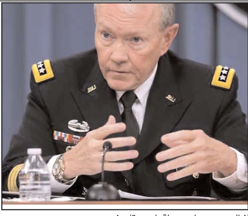
بقیه در صفحه ۴

کرد: عملیات تکریت تنها به یمن حملات هوایی ما علیه مواضع داعش در بیچی ممکن شد. داعش با تداوم این حملات هوایی تضعیف شده است. فرماندهی ستاد مشترک ارتش عراق همچنین تأکید کرد: می خواهم مطمئن شوم که نخست وزیر و وزیر دفاع عراق نیز متوجه اند که عملیات تکریت ناگهان و تنها با حمایت مالی و نظامی ایران رخ نداده است. این گونه نبوده که ناگهان معجزه های رخ دهد و نیروهای شیعه از بغداد به سمت تکریت حرکت کنند. ماه ها تلاش و برنامه ریزی استراتژیک ما، راه را هموار کرده است.