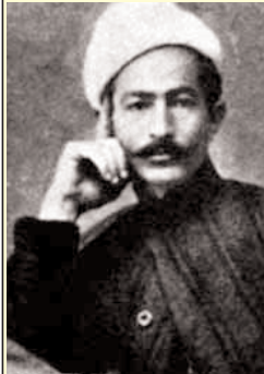
شعر زیبای عارف در مذمت آخوند و ارتجاع

نویسنده: پیتر بینارت اغلب مقالات دیوید بروکز (روزنامه نگار محافظه کار آمریکایی که برای نیویورک تایمز می نویسد) را ستایش می کنم، حتی اگر با آن ها مخالف باشم. آن ها را ستایش می کنم چون بروکز از یک جمهوریخواه هم محافظه کارتر است. ریشه استدلال هایش در ارزش های محافظه کارانه است نه در دیدگاه های روز جمهوریخواهان. در سیاست داخلی، به میزان زیادی روح فراموش شده نوحافظه کاری دهه ۱۹۷۰ را دارد که بدون برخوردی احساسی با سرمایه داری ازبندرهاشده، بر محدودیت های برنامه ریزی دولتی تأکید می کرد.