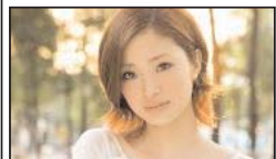
لطفاً انگلیسی صحبت کنید