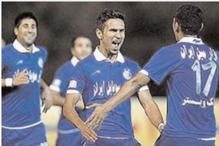
دومین پیروزی استقلال در مسابقات برگشت لیگ برتر