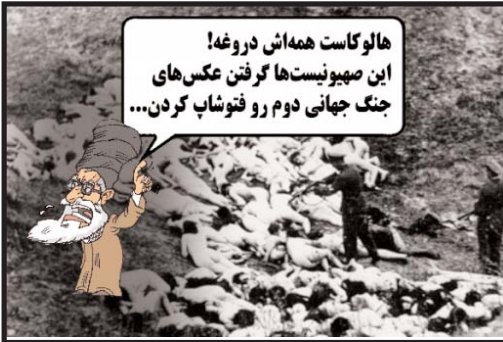
هالوکاست همهاش دروغه! این صهیونیست ها گرفتن عکس های جنگ جهانی دوم رو فوتسآپ کردن...