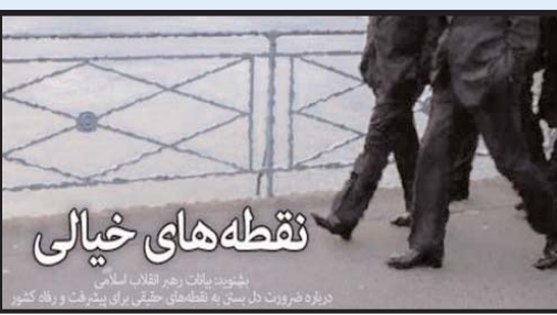
نقطه های خیالی

شریعتمداری در روزنامه کیهان از نقش و تأثیرات افراد این گروه در وزارت خارجه و برخی مناسب مهم اقتصادی آشکار ساخت، نقطه آغازین انتقادهای علیه وی را تماس تلفنی باراک اوباما با حسن روحانی در نیویورک دانست، در آن زمان رسانه های مخالف نوشتند که کار هماهنگی این تماس بر عهده باند نیویورکی ها بوده و جواد ظریف در راضی کردن روحانی به منظور گفت و گو تلفنی با رییس جمهوری ایالات متحده نقش عمده ایفا کرده است.