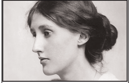
بقیه در صفحه ۴

بهمین ماه هفته اول را پشت سر می‌گذارد و به روز "امام آمد" می‌رسد؛ روزی که قرار بود سرآغاز آبادی و آزادی ایران باشد. پول نفت بر سر سفره‌ها برود و حتی مارکسیست‌ها آزادانه سخن بگویند. شیطان بزرگ از اریکه فروافتد، پرچم ظفر نمون اسلام بر فراز کاخ‌های سرخ و سفید به اهتزاز درآید و رابطه "میش" ایران با "گرگ" آمریکا دیگر شود. و درست همین روزها وزیر خارجه نظام" که از افسانه قهرمانی اش لبخندی چند منظوره باقی مانده است، همراه وزیر خارجه آمریکا که لابد برای خوشامد حریف حتی کراوات سبز همیشگی را هم بگردن ندارد؛ در خیابان‌های ژنو قدم می‌زنند. همزمان در تهران دور تازه بازداشت فعالان مدنی و دانشجویی فعالان توسط سپاه پاسداران می‌کنند. ولی فقیه دوم که میراث فتوای قتل سلمان رشدی را از ولی فقیه اول به ارث برده است در ماجرای "چهارشنبه سیاه پاریس" در کام اول از سخت‌گیری بر "کفار" به جای محکومیت تروریسم سخن راند. در کام حتی یک گام عقب می‌نشیند و جوانان غربی را به مطالعه مستقیم قرآن، اسلام‌شناسی و پیوستن به صفوف اسلامی دعوت می‌کند. اکبر گنجی، می‌نویسد: "عجیب است رژیم خودکامه‌ای که مدعی است نه تنها نواندیشان دینی ایرانی اسلام را نمی‌فهمند، بلکه فقیهی چون آیت‌الله صاعی را به دلیل فتوای نوگرایانه- در محدوده سنت فقیهان- توسط جامعه مدرسین حوزه علمیه قم (فقیهان درباری) از مرجعیت خلع می‌کند، حالا کارش به کجا رسیده است! محمد مجتهد شبستری و مصطفی