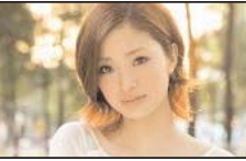
لطفا انگلیسی صحبت کنید

توسط ماساژورهای Latino و woman Asian 213-909-6980