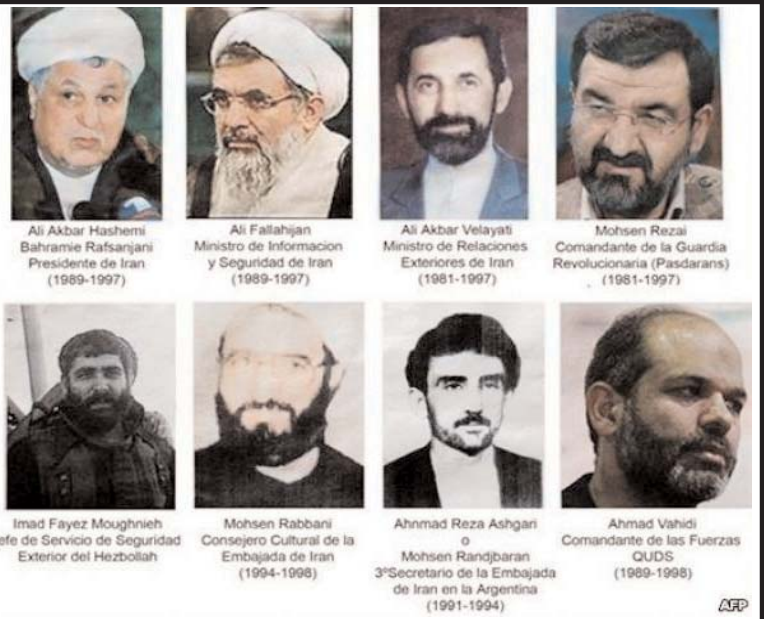
فریبرز سروش همزمان با کشف جسد دادستان آرژانتینی درگیر در پرونده انفجار مرکز یهودیان بنونس آیرس، بار دیگر نگاه متوجه طرفین درگیر این پرونده کش دار و پر از ابهام شد. ماجرا از آنجایی کلید خورد که هجدهم ژوئیه سال ۱۹۹۴ برابر با تیرماه ۱۳۷۳، بمبی قوی در مرکز هم یاری یهودیان آرژانتین منفجر شد که بر اثر آن ۸۵ نفر کشته و بیش از ۳۵۰ نفر از شهروندان یهودی تبار آرژانتینی زخمی شدند. مرکز هم یاری یهودیان در واقع نام ساختمانی هفت طبقه بود که مرکز همکاری های اسرائیل و آرژانتین با نام اختصاری آمیا در آن قرار داشت. اما اینکه چرا بلافاصله بعد از انفجار نگاه متوجه گروه های مبارز فلسطینی و بالطبع جمهوری اسلامی ایران شد، خود حکایت دیگری است که به آن می پردازیم.

بنابر شواهد موجود و بر اساس ادعاهای افراد مسول در پرونده آمیا، در تاریخ قضایی آرژانتین کار رسیدگی به هیچ پرونده ای به اندازه پرونده انفجار آمیا به درازا نکشیده است، به طوری که تا کنون بیش از هزار و دویست نفر برای ادای شهادت در مورد انفجار آمیا به دادگاه احضار شده اند و دولت آرژانتین نیز تا کنون سه بار جمهوری اسلامی ایران را به دست داشتن در پرونده متهم کرده است. به عبارت دیگر دولت آرژانتین مدعی است که نقشه ضربه زدن به بزرگترین مرکز اقلیت یهودیان در آمریکا لاتین در تهران کشیده شده و مسوولیت اجرای طرح نیز به ستاد ویژه عملیات حزب الله لبنان وابسته به شبه نظامیان حزب الله سپرده شده است. این موضوع بارها از سوی دستگاه قضایی و دیگر مسوولان اجرایی در دولت آرژانتین مطرح شده است. در مقابل مقام های ایرانی به تناوب با طرح این موضوع که آرژانتینی ها بدون سند و مدرک سخنی می گویند و هیچ مدرکی دال بر دخالت جمهوری اسلامی وجود ندارد، سیستم قضایی آرژانتین را فاسد و طرح نام ایران را