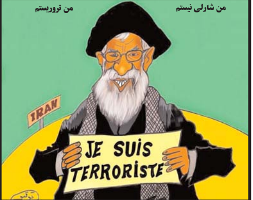
من شارلی نیستم من تروئیستم