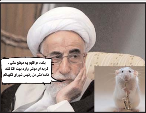
بنده مواظبم به موقع سگی، گریه ای موشی وارد بیت اقا نشه، ناله ای من رئیس شورای نگهبانم

همشهریهای اصفهونی رو از چهار تا چیز میشه شناخت: - همشون زیرشلواری آبی راه راه دارن - هر قلوپ نوشابه که میخورن به شیشه نگاه میکنن ببینن تا کجاش رفته - جلوی در وامیستن و به جای اینکه بگن بفرمایین تو، میگن حالا چرا یکی نیست بهشون بگه آخه عزیز من! ازدواج که قصد نمی خواد، میخورن حتما درش رو میلیسن