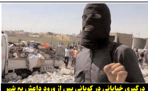
درگیری خیابانی در کوبانی پس از ورود داعش به شهر

داعش پرچم خود را در مرز ترکیه و سوریه برافراشت