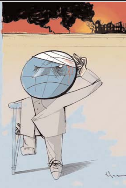
راهبرد پیدا می کنند: شده است. به اتکا به همین شانس وقتی از رژیم در حوزه حقوق بشر گرفته می شود

چهار راهبرد گریز جمهوری اسلامی از پاسخ گویی به گزارش های نقض حقوق بشر در ایران