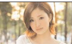
لطفا انگلیسی صحبت کنید

ماساژ توسط ماساژورهای Latino و Asian woman 213-909-6980