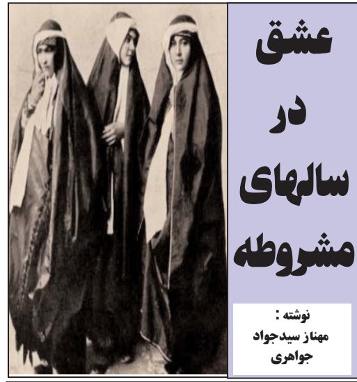
نوشته : مهناز سیدجواد جواهری

اوکازيون ۱-فروشگاه معروف لوازم خانگی و کادونی استارلایت با کلیه وسایل واگذار می شود ۲- مجتمع کارواش ،بادی شاپ و مکانیک شاپ به مساحت یک و نیمه ایگر درسیمی ولی واگذار می شود ۳۱۰-۶۶۶-۶۱۵۹ با امیر تماس بگیرید