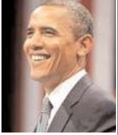
باراک اوباما، رئیس جمهوری آمریکا گفته است که اجازه تشکیل خلافت اسلامی در سوریه و عراق را نخواهد داد.

آقای اوباما در نطق رادیویی هفتگی اش گفت که اسلام گرایان تندرو زنان را به بردگی می گیرند و اقلیت یزیدیان عراق را تهدید به نابودی کرده اند. او گفت که حملات هوایی آمریکا می تواند به شکستن محاصره آوارگان یزیدی که در کوه ها گرفتار شده اند، کمک کند. رئیس جمهور آمریکا گفت که این کشور در سرتاسر عراق از جمله بغداد و اربیل کارکنانی دارد که هر اقدامی که لازم باشد برای حفاظت از آنها انجام خواهد داد.