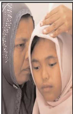
یک دختر اندونزیایی که گمان می رفت سونامی سال ۱۳۸۳ او را با خود

برده بود، در ۱۴ سالگی پیدا شد و به خانواده خود ملحق شد. رانده‌ها تو جناح ۴ ساله و برادر ۷ ساله اش آخرین بار زمانی دیده شدند که امواجی بزرگ خانه آنها را در ۶ دی ۱۹۸۳ در غرب آچه در نوردید. گمان می رفت که این دختر مرده باشد اما در ماه ژوئن عمویش دختری در یک روستای دیگر را که بسیار شبیه او بود، شناسایی کرد. پس از بررسی‌ها، مشخص شد که یک ماهیگیر این دختر را از میان امواج نجات داده بود و به مادرش تحویل داده بود که او را بزرگ کرد. برادر این دختر هنوز ناپدید است.