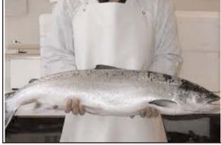
ماهی سمن پاوندی ۵/۹۹ دلار