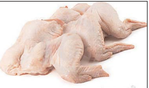
بال مرغ پاوندی ۲/۲۹ دلار