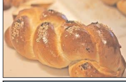
با خرید ۲۵ دلار یک نان مجانی بگیرید