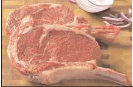
ریب استیک پاوندی ۹/۹۹ دلار