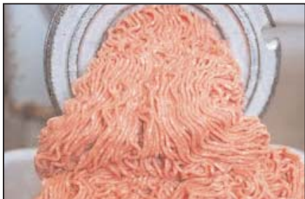
گوشت چرخ کرده پاوندی ۳/۹۹ دلار