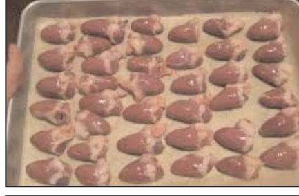
دل مرغ پاوندی ۶/۹۹ دلار