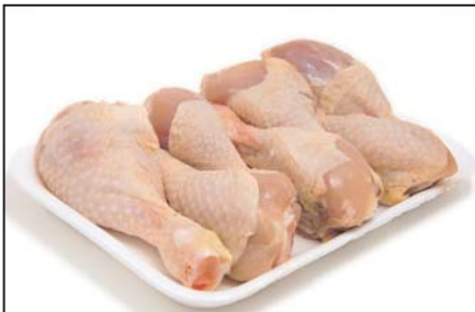
پای مرغ پاوندی ۲/۴۹ دلار