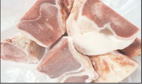
پای گوساله پاوندی ۳/۹۹ دلار