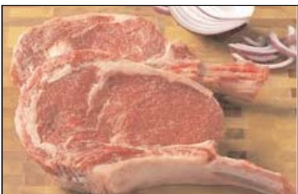
ریب استیک پاوندی ۹/۹۹ دلار