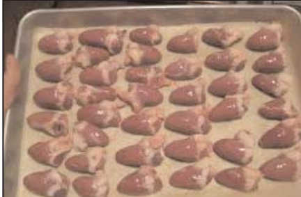
دل مرغ پاوندی ۶/۹۹ دلار