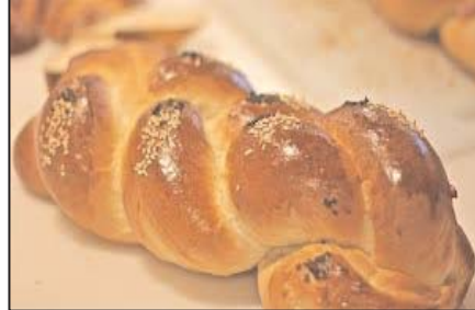
با خرید ۲۵ دلار یک نان مجانی بگیرید