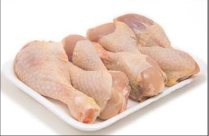
پای مرغ پاوندی ۲/۴۹ دلار