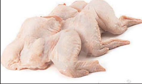
بال مرغ پاوندی ۲/۲۹ دلار