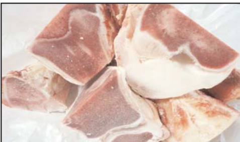
پای گوساله پاوندی ۳/۹۹ دلار