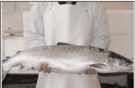
ماهی سمن پاوندی ۵/۹۹ دلار