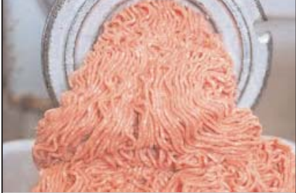
گوشت چرخ کرده پاوندی ۳/۹۹ دلار