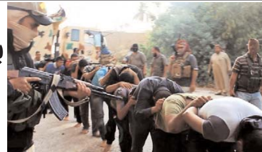
اعدام دستجمعی عراقی های دستگیر شده توسط داعش

در عراق برای مقابله با داعشی بسیج مردمی تشکیل شد