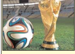
دوکلمه حرف حساب

روزنامه ی "نیویورک تایمز" در بخش دیدگاه های خود با انتشار یادداشتی با عنوان "حکومت مذهبی، زندگی تجملی"، به وضعیت اقتصاد ایران بعد از روی کار آمدن دولت روحانی پرداخته خاطر نشان می کند که در ایران کنونی حتی مدرک دانشگاهی زندگی نمی تواند شانس داشتن یک زندگی بهتر را برای مردم افزایش دهد. این روزنامه معتبر امریکایی در شماره روز سه شنبه (۲۰ خرداد-۱۰ ژوئن) در گزارشی به قلم شهرزاد الفانیان با اشاره به شکاف طبقاتی و زندگی فوق تجملی شمار معدودی از مردم در تهران می نویسد: ثروتمندان در تهران، اتومبیل هایی همچون پورشه، فراری و مازراتی سوار می شوند و در آپارتمان های چندمیلیون داری لوکسی با لوازم