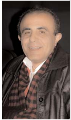
یژن صف سری

حای یک پیام خاص است و آن فریاد شدن و حتی "از دید تاریخ پنهان ماندن" است. چرا که در همه تاریخ ملل جهان از پادشاهان، ژنرالها، وزیروان اعظم، پاپها، بانگدارها، کارخانه داران، هنرمندان بزرگ، دانشمندان و فلاسفه بر نام مردان متمرکز است و تمامی اینان نیز به استثناء چند ملکه، امپراطور و ژاندارک مرد هستند. و تنها زمانی از زن حرف به میان میاید که اراده محدود جنس مخالف وجود داشته است و ریشه تمیل های سخنی چون تشبیه زنان به "هلو" و "شکلات" و "واز سوی ولایتداران" و "ولایی آبخوری از این واقعیت نظام دارند.