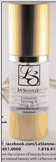
facebook.com/LaSienne. 451.0000 1.818.41 Over the science of beauty from inside, your natural beauty with LaSienne skin.

سرم خاویار لاسین برایحتی چین و چروک های صورت شما را برطرف و شفافیت روزه های جوانی را به شما ارزانی می کند برای سفارش لاسین با تلفن زیر تماس بگیرید ۰۰۰۰ - (۸۱۸)۴۵۱