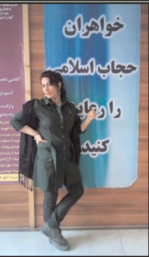
زنان ایرانی از گوشه‌وکنار کشور هریک عکسی از خود در فضای عمومی را برای انتشار در این صفحه می‌فرستند. عکسی که در آن

داستان از اینجا پا می‌گیرد: شما - مرد خانه - در سفرید، در خوزستان، در شوش دانبال، مرد ناشناسی به شما زنگ می‌زند و از شما می‌پرسد: جناب خامنه‌ای، آیا شما اکنون در بیمارستانی‌اید؟ شما با کمی تردید پاسخ می‌دهید که نه، مگر خبری