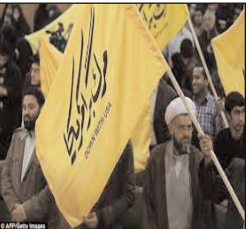
محمد علی جعفری فرمانده سپاه هستند. رهبر ایران شاید اجازه داده است که این گفتگو ها در بالاترین سطح ادامه پیدا کند تا بقیه در صفحه ۴

روانای و جواد ظریف و توافقی که به آن رسیدند استفاده می کند. او می گوید که ایران نباید توافق اتمی را که بموجب آن برنامه غنی سازی تا شش ماه به تأخیر می افتد امضا می کرد. او می گوید ظریف زمانی که گفت در این توافقنامه حقوق ایران رعایت شده، روحانی و رهبر را فریب داده است. او گفت: این آقا راست نگفت. آیا تندرو هایی مانند شریعتمداری و فرمانده سپاه خواهند توانست توافق را به بن بست بکشند؟ یک بانگدار ایرانی به من گفت: "ظریف حمایت نود درصد مردم را برای توافق و برداشته شدن تحریم هایی که ایران را منزوی کرده بود، دارد. اما تصویری که شریعتمداری از فرمانده سپاه می دهد، چیز دیگری است. قدرت سپاه پاسداران بسیار زیاد است. روحانی در یک مصاحبه در نیویورک گفت فکر می کند که سازمان های امنیتی سپاه باید قدرت کمتری در ایران داشته باشند. اما زمانی که از او در مورد انتقاد های شریعتمداری پرسیدم او آن را تبلیغ انتخاباتی نامید. تهران امروز شهری است بین پیونگ یانگ و لس آنجلس. این شهر پر است از آدم های شیک پوش و معاشرتی. شعار سال ۱۹۷۹ در میان دیوار ها رنگ می بازد. اما ریشه های تندروی همچنان وجود دارد. شریعتمداری از نقاشی دیواری بزرگی در خیابان کریم خان زند حرف می زند که تصویر آیت الله خمینی است با این نوشته: "ما