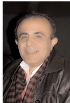
بیژن صف سری

ترجمه و ضمیمه می کند و بقولی با این کار سرود یاد مستان می دهند. اما با این همه با اینکه از آن روز بیش از ۱۵۰ سال می گذرد، هنوز ملت ایران از اشتیاق حاکمیت قانون در کشورش، می سوزد و دست و پا می زند تا بلکه به ابتدایی ترین و اساسی ترین حقوق خویش دست یابد؛ اما گویی زمان از حرکت باز ایستاده و دربر همان پاشنه که بود می چرخد.