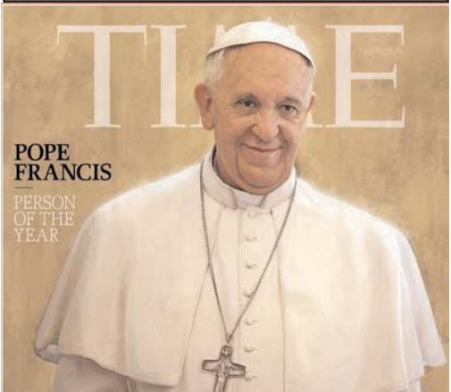
POPE FRANCIS PERSON OF THE YEAR

مجله آمریکایی تایم، رهبر کاتولیک های جهان را به عنوان مرد سال ۲۰۱۳ برگزید. به اعتقاد گردانندگان تایم، تاکنون در صحنه بین المللی کمتر کسی توانسته مانند فرانسیس اول در مدتی کوتاه بیشترین توجه جهانیان را به خود جلب کند. خورخه برگولویو، اسقف اعظم بوینس آیرس در ماه مارس سال جاری به عنوان رهبر کاتولیک های