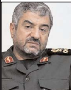
سخنان آقای ظریف واکنش های گسترده ای را در میان منتقدان دولت حسن روحانی در پی داشته و از جمله حیدر مصلحی، وزیر سابق اطلاعات، او را "نقلم خطاب کرد."

مجلس نهم ۲۲۲ بار به رئیس دولت تذکر داده اند. در گزارش معاونت نظارتی مجلس آمده است، در این دوره تذکر به وزرات خانه های بدون وزیر به رئیس جمهور منعکس شده که علت اصلی بالا بودن میزان تذکرها است.