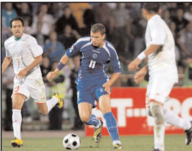
بوسنی مقابل ایران تا الان بوده است.

بوسنی تا کنون ۶ بار با تیم ملی کشورمان مصاف داده که در این بازی ها تیم ایران ۴ بار برنده بوده، یک بار دیدار دو تیم به تساوی انجامیده و یک بار هم بوسنی به پیروزی رسیده است