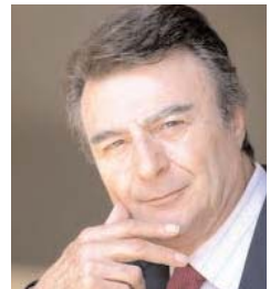
پرویز قاضی سعید

روز بعد از آن هم آقای خامنه ای ظاهران در میان بسیجیان و فرماندهان سپاه که خود را «فدائیان امام خامنه ای» می نامند، آنچه را که توانست نثار آمریکا و اسرائیل و فرانسه کرد و هشدار داد، و با آنکه گفته می شود امسال گره کور مذاکرات باز خواهد شد، اما همچنان زرمزه هایی به گوش می رسد که گاه ناامید کننده و گاه امیدوار کننده است.