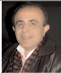
یوشف صف سوری

توافقات پنهانی اسرائیل با فرانسه در ماجرای مخالفت لوران فابیوس وزیر امور خارجه فرانسه در دور قبلی مذاکرات، تمق بر ادعای مقامات جمهوری اسلامی را موجه می سازد طرفه آنکه نخست وزیر اسرائیل ضمن دیدارهای خود با سران کشور های عضو گروه ۵+۱ با هدف برهم زدن اجماع هیئت گروه مذاکره کننده در پایان درایی به مناقشات هسته ای جهان با جمهوری اسلامی، تا کنون چندین بار به صراحت اعلام نموده که اسرائیل برای رفع نگرانی های خود بدون در نظر داشتن نتیجه این مذاکرات راسا اقدام خواهد کرد.