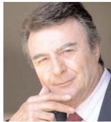
پرویز قاضی سعید

کامل و در بسیاری از موارد بیشتر از ضرورت داشتند و دو دسته از مردمان در انقلاب شرکت کردند. ساده لوحانی که باور میکردند دولت یک مملکت می تواند در آمد یک کشور را در میان عامه مردم تقسیم کند! یعنی حرص بیشتر داشتند. و زیاده خواهی اما دسته دیگر، به اصطلاح روشنگرانی بودند که با خواندن چهارتا کتاب کمونیستی و با مطالعه مارکس و انگلس تصورشان این بود که بزودی بر اریکه قدرت می نشینند و خیالاتی خام و پخته را برای تشکیل احزاب سیاسی عریض و طویل به مرحله اجرا میگذارند. اما همگان میدانند که این دو گروه، ساده دلان و تاریک اندیشان و آنها که خود را روشنگر می پنداشند بی آنکه بتوانند از نوک بینی خود دورتر را به بینند، فریب استعمار را خورده بودند، همان گونه که یک رئیس جمهور بی خبر از سیاست های دنیا آقای کارتر کشاورز رو دست انگلستان را خورده بود بی آنکه یک لحظه فکر کند، انگلستان از سی و پنج سال پیش که از ایران رانده شد. به وسیله شادروان مصدق و بعد قدرت نمائی پادشاه فقید به اتکای آمریکا، نقشه داشت که آمریکا را بیرون راند و جایگاه قدیمی خود را با بر کشیدن حقوق بگیران قدیمی کمپانی "هند شرقی" بدست آورد! چرا در هیاهوی این روزها درباره احتمال تجدید رابطه آمریکا و حکومت اسلامی ایران حرف های "نستا" تکراری را می نویسم؟ دقیقاً برای روشن شدن همین بازی «رابطه» دولت جدید آقای روحانی و احتمالات و روشن شدن ذهن خوانندگانی که احتمالاً می توانند فریب این بازیها را خورده باشند، بقیه در صفحه ۴