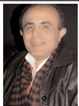
بیژن صف ساری

شد اما نگرانی هایی را در بین دول جهان باعث گردید که نمونه بارز آن هشدار "کاترین اشون" مسوول سیاست خارجی اتحادیه اروپا به دولت مردان آمریکایی است که از ترس اینکه مبادا، آمریکا از مواضع خود در باره ایران عقب نشینی نماید، به مقامات کاخ سفید پیغام می دهد "مبادا فضای ایجاد شده برای گفتگو با ایران را از دست بدهید."