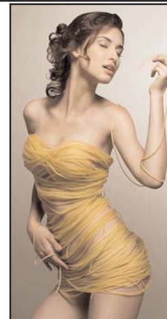
نوشته ای از ستاره

عواقب آن که همانا انواع و اقسام بهره کشی و استثمار زن است. محبت و عشق (به فارسی: دوست داشتن و مهرورزی) یک امر انسانی و عاطفی است. با گزینه هم بسیار بسیار فاصله دارد. عشق و مهر ربطی به سن و سال و جنسیت و وضعیت زستی انسانها ندارد و نیازمند و گدای حضور فیزیکی هم نیست. عشق نیازمند به فیزیک، عشق نیست بلکه گزینه است که ربطی به عواطف ندارد و در مقوله هنر و ادبیات چنین امری اگرچه طبیعی و نرمال اما فاقد ارزش است.