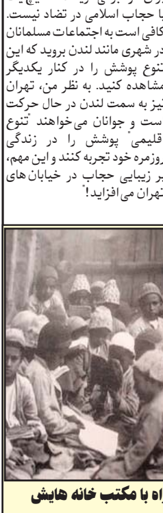
تصویری از تهران قدیم همراه با مکتب خانها هایش