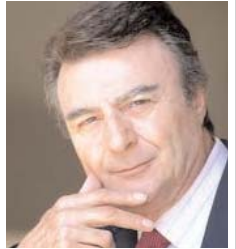
پرویز قاضی سعید

سایر واپس گرایان افراطی مقاومت کنند! تاکنون آمریکا توانسته و یا نخواسته یک گروه مشخص را برای جانشینی سد معلوم کند و یا حداقل تا این لحظه نشان نداده است که از دسته خاصی جانبداری میکند بنابراین یکی از پیچیده ترین مسائل، همان تنها راه جلوگیری از جنگ یعنی برکناری بنشار است. اما اصل قضیه چیست؟! چه شده است که ناگهان منطقه خاورمیانه به هم ریخت و چرا جز در ایران ما در نقاط دیگر واپس گرایان مذهبی نتوانستند به بهانه اجرای «قانون شریعت»