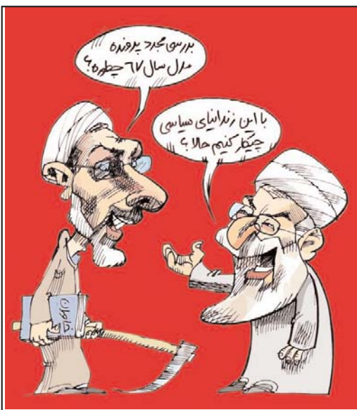
راه حل پور محمدی (وزیر دادگستری)

یارا شاهیدی دختر نوجوان ایرانی تبار، بازیگر محبوب هالیوود هرروز بهتر از دیروز می درخشد و در سینه های هالیوود مطرح می شود