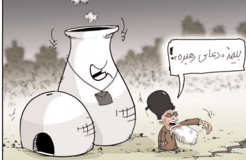
نیروگاه بوشهر در کمال صحت و سلامت

رابرت بیلز* که برای نجات از اعدام، به جرم خود اقرار کرده گفته است در اثر لطمات روانی ناشی از جنگ به چنین کاری دست زده است . دادگاه نظامی او را به حبس ابد بدون امکان بخشودگی محکوم کرد .