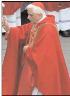
کاردینالهای سراسر جهان با تماشای غیررسمی بحث و جستجو

را بر سر اینکه چه کسی رهبری کاتولیکهای جهان را بدست گیرد آغاز کرده اند. در کنفرانس مطبوعاتی روز سه شنبه واتیکان، گفته شد که پاپ ۸۵ ساله به دلایل پزشکی یک وسیله تنظیم کننده ضربان قلب را در تمام اوقات با خود حمل می کند. در همین کنفرانس مطبوعاتی درعین حال گفته شد که هیچ بیماری خاصی موجب استعفاي رهبر کاتولیکهای جهان نشده، بلکه کپولت سن و کاهش بنیه های ذهنی و فیزیکی دلایل اصلی این استعفا بوده اند.