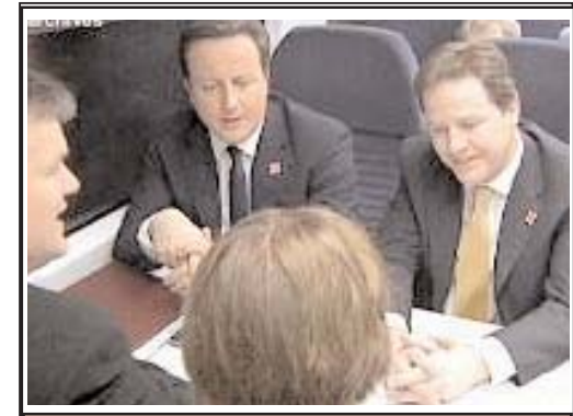
ادعای بنیامین نتانیاهو، نخست وزیر اسرائیل